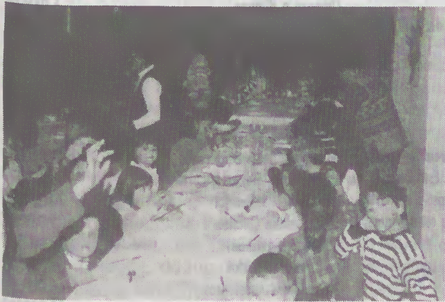
Que o Menino Deus a todos ajude para que este novo ano a todos seja favorável.

Além de outras quero assinalar a festa dos nossos caríssimos Deficientes Mentais da Quinta do Paiva, o Centro Social da J. U. M. (Juventude Unida Marinhas) — quer a nível de crianças quer a nível de idosos e funcionários, o F. C. de Marinhas abrangendo todos os escalões, os Jovens, os Escuteiros e, sobretudo, as Escolas de Ensino Básico. Para ilustrar este ambiente de festa e alegria aí está a foto que assinala um momento da festa da Escola de Pinhote — Outeiro, na altura das prendas no restaurante Bem-Estar.