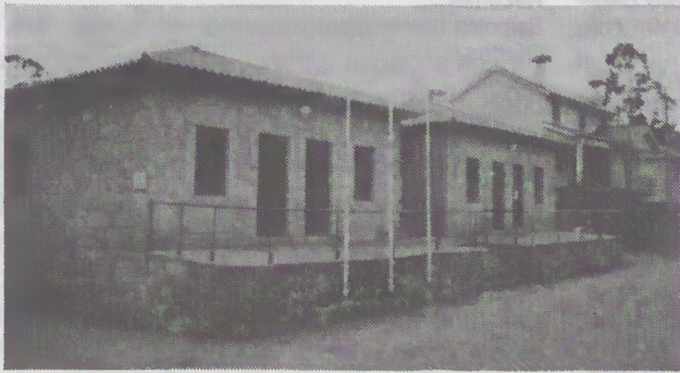
Sede da Junta de Gemeses