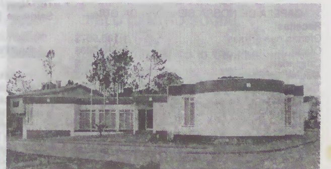
Sede da Junta de Palmeira

Esposende receberá, deste modo, 77 mil contos para reabilitação urbana.