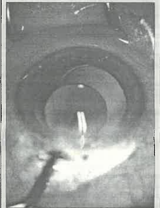
Introdução de lente intra-ocular após Facomeulsificação do cristalino