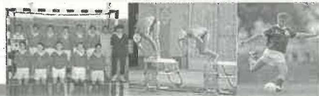
Coordenação: Emílio Vilarinho