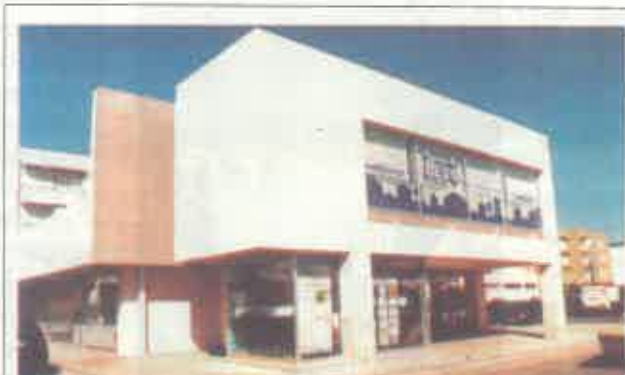
RUA STA. MARIA DOS ANJOS - EDIF. FONTE DA MATRIZ - 1.º ANDAR - ESCRIT. 1 APARTADO 43 TEL./ (053) 966398 - 4740 ESPOSENDE