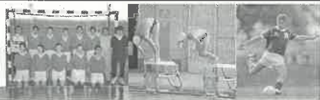
Coordenação: Emílio Vilarinho