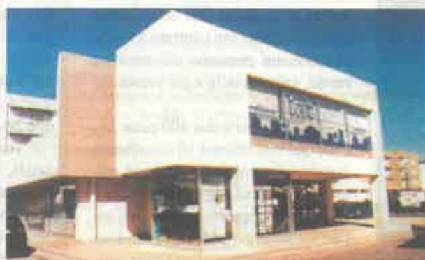
RUA STA. MARIA DOS ANJOS - EDIF. FONTE DA MATRIZ - 1.º ANDAR - ESCRIT.1 APARTADO 43 TEL./ (053) 966398 - 4740 ESPOSENDE