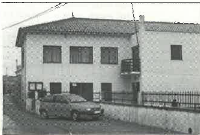
Dr.ª Ivone Magalhães.

As actividades agro-marítimas em Fonte Boa foram objecto de uma palestra pela