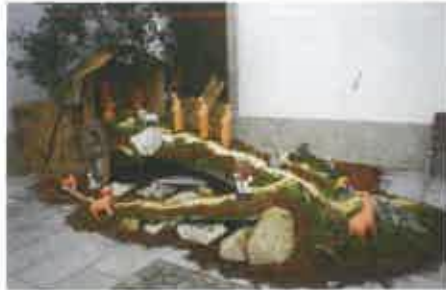
2 Adro - Comissão Pastoral