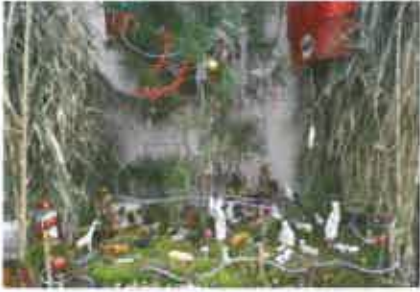
25 Café colada da Noiva