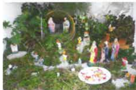
5 Nel Lapetiro