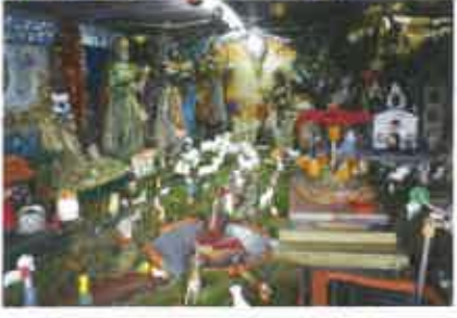
28 Calheta - Alf. Figueiredo