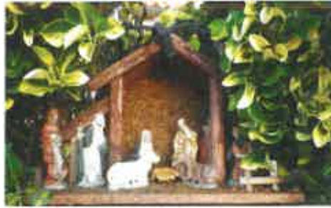
20 Leonorido e Luis Capitulo