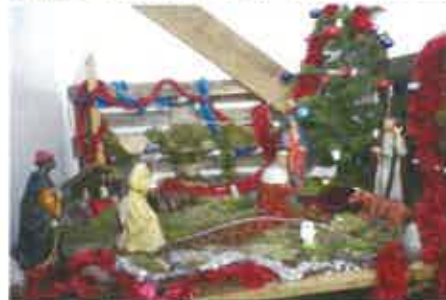
14 Esperanças e Antoninho