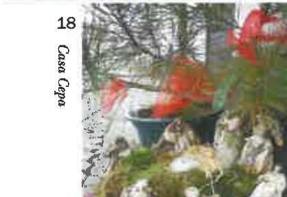
18 Casa Cepa

Nota: Os artigos assinados são da inteira responsabilidade dos seus autores.