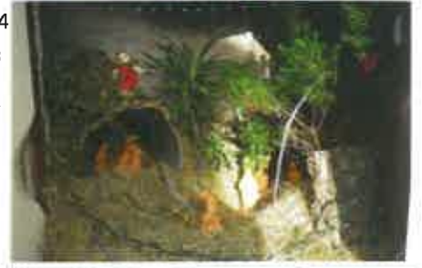
24 Tone Agripio