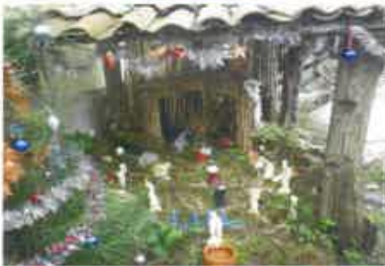
4 Adria Carqueiro