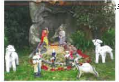
3 Gloria Pedreiro