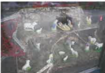
10 Junia Freguesi