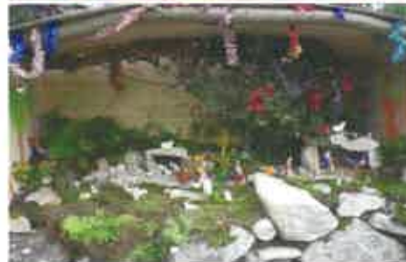
17 Zé Abílio