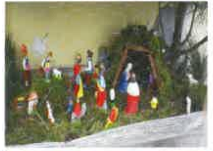
6 Nando Telleiro