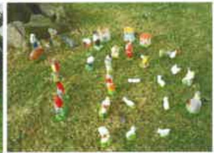
9 Azira Cepa