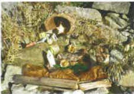
13 Paula Cepa