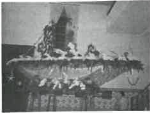
Andor de S. Bartolomeu 2021

Não há, no concelho de Esposende, Romaria como a de S. Bartolomeu do Mar. Pelas suas particularidades que envolvem os devotos e pela muita procura para agradecer ou