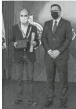
A Escola António Correia de Oliveira, Esposende foi distinguida com a Medalha de Mérito

No dia 19 de agosto, Esposende comemorou o Dia do Município e da Cidade com o hastear da bandeira e uma eucaristia e uma sessão solene onde foram distinguidos cidadãos e instituições.