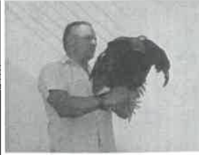
Os galináceos são leiloados.