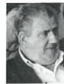
Correspondente: Manuel Fernando*