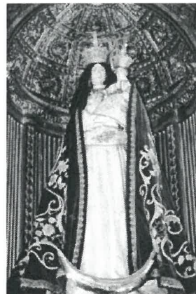
Imaculada Conceição de Vila Viçosa.

No próximo dia 29 de novembro, começa, na vida da Igreja, a novena preparatória da solenidade da Imaculada Conceição da Virgem Santa Maria, que se celebra no dia oito de dezembro, dia santo de guarda, em que os cristãos têm o dever de participar na Missa inteira e abster-se dos trabalhos servis.