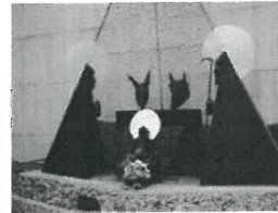
Presépio do Santuário de Fátima-Leiria

A situação de pandemia que o país vive está a fazer antecipar toda a vivência do Natal, sobretudo em termos comerciais. Por isso, já cheira a Natal. São diversas e muitas as tradições características desta festividade que a nossa comunidade tem vindo a manifestar publicamente.