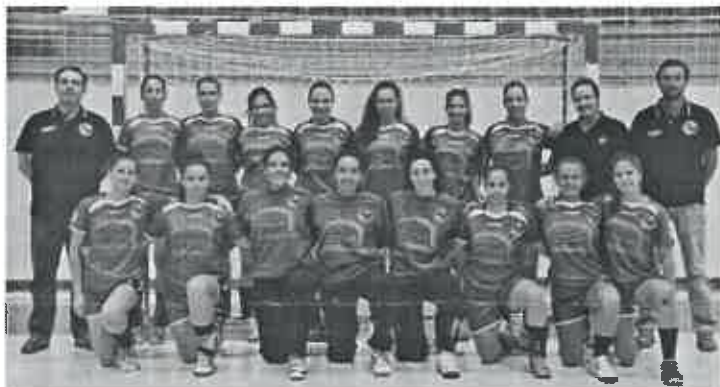
Equipa de Seniores da 1ª Divisão Nacional do Centro Social de Mar.

Já estão em plena competição todas as atletas que na época 2014-2015 participam nos vários campeonatos nacionais., distribuídas pelos escalões de Minis, Bambis, Infantis, Iniciadas, Juvenis e Seniores. São no total uma centena de jovens que todos os fins de semana defendem com bravura e orgulho as cores do Centro Social da Juventude de Mar.