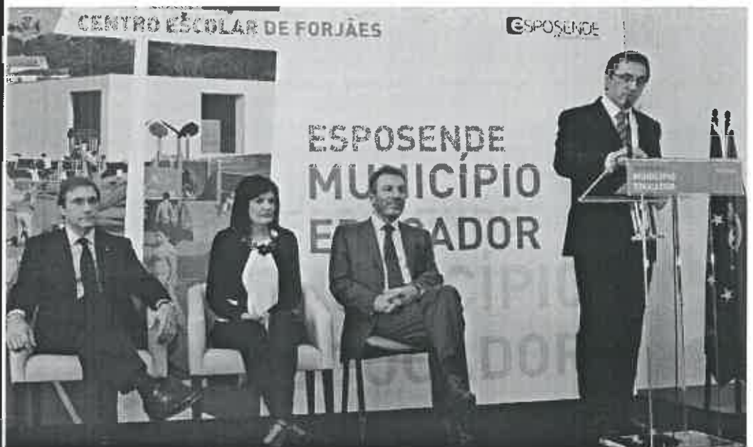
A Diretora do Agrupamento das Marinhas entre Passos Coelho e Nuno Crato