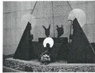
Presépio do Santuário de Fátima

A XIV edição dos "Presépios nas Ruas de Mar" vai marcar, uma vez mais, a freguesia de S. Bartolomeu do Mar, no concelho de Esposende.