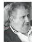
Correspondente: Manuel Fernando*