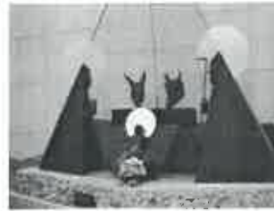
Presépio do Santuário de Fátima

Por todo o iado já cheira a Natal, festa que se aproxima a toda a velocidade. São diversas e variadas as tradições características desta festividade que a nossa comunidade tão bem sabe manifestar publicamente.