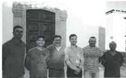
Comissão de Festas de S. Pedro - 2018

mãos a medir, pois querem deixar a sua marca. Por isso, as surpresas vão surgir: a homenagem aos emigrantes vai constituir um momento alto dos festejos, como foi o lançamento da réplica da imagem da Senhora da Guia, em marfinita, que é uma peça única! Só pretendem uma "festa digna" e "que tudo corra bem, segundo adiantaram à reportagem do "Brisa de Mar" .