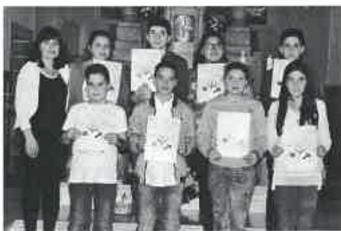
Festa das Bem-Aventuranças