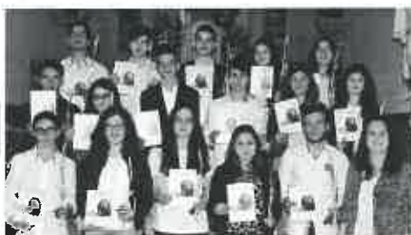
Festa do Envio