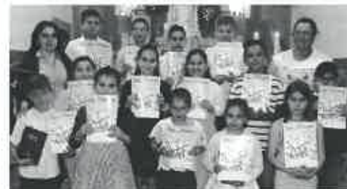
Festa da Palavra

Nesta entrega, o pároco chamou cada criança pelo seu nome e, colocando a sua Bíblia nas suas mãos, disse-lhe: «Prometes continuar a ler a Palavra de Deus, para ser luz e força na tua vida?» Ao que cada criança respondeu: «Sim, prometo». O pároco acrescentou: «Que o Senhor realize em ti o que prometes». Respondendo a criança «Ámen».