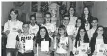
Festa do Compromisso