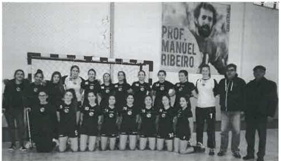
As Juvenis da Juventude de Mar conquistaram o segundo lugar do Torneio p.