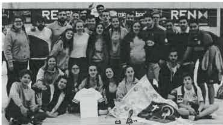
Os Jovens Unidos de Belinho, (JUB) sagraram-se, no passado fim

de semana dia 25 de fevereiro, tricampeões no torneio masculino de futsal JOEMCA (Jovens Em Caminhada). Esta é já a sexta vez que a equipa masculina arrecada o título contando apenas com oito participações. O prémio de melhor marcador masculino veio também na mesma bagagem desta equipa. De evidenciar ainda a excelente prestação da equipa feminina que trouxe para Belinho um humilde e cheio de valor 4º lugar.