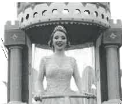
A Rainha Beatriz I encantou o Corso

e princípio da tarde ter ameaçado o curso carnavalesco de Rio de Moinhos, Marinhas, no concelho de Esposende, valeu a intervenção de S. Pedro que fez com que a chuva parasse e permitiu que os dezanove carros saíssem à rua e percorressem as principais ruas do lugar marinhasense. Cor, alegria, e muita, mas muita animação constituíram o mote para a muita assistência se rir e dar largas à folia própria desta quadra.