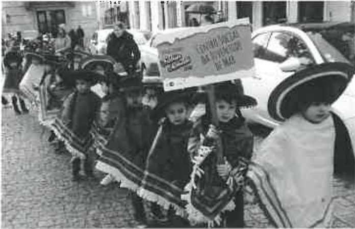
Mais um carnaval ecológico em Esposende! Este ano com o Tema: "Viva la fiesta"...