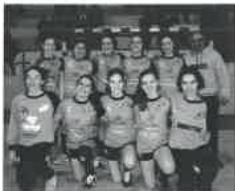
Equipa da Didaxis, vencedora em Juvenis

As equipas da Didaxis , em Juvenis, do Maiastars , em Iniciados, do Cale , em Infantis e da Juve Mar , em Veteranas, conquistaram o XIV Torneio de Andebol Feminino - Prof. Manuel Ribeiro, que se realizou em Esposende entre os dias 9 e 12, evento organizado em parceria entre o Centro Social da Juventude de Mar e a Câmara Municipal de Esposende.