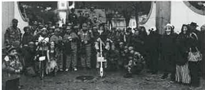
Foi no passado dia 11 de fevereiro que o Grupo de Jovens de Beli-

inho (JUB) realizou mais uma edição do Carnaval em Belinho.