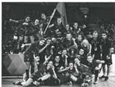
Seleção Nacional de Andebol Sub 17

A equipa lusa, venceu, na final, a equipa da casa, por 25-24, o que demonstra o equilíbrio entre as equipas.