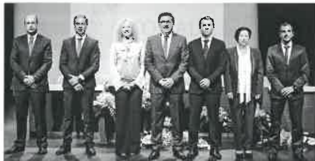
Executivo do Município de Esposende