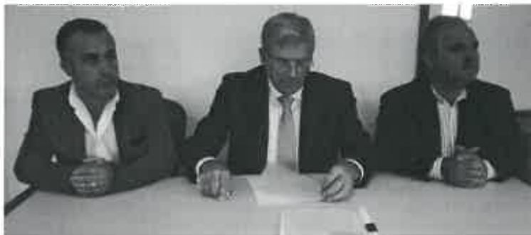
Junta da União de Belinho e Mar