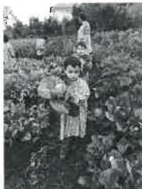
... depois colhe-se...

Que bom que é mexer na terra e encontrar bichinhos a fugir das nossas mãozinhas.