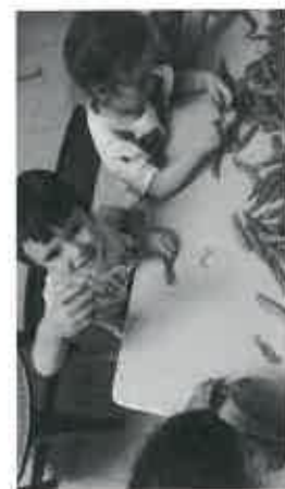
... e no final consome-se.