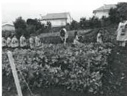
Na horta, primeiro planta-se...

Que bom que é tirar as ervilhas para a horta ficar limpinha.