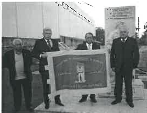
A Junta da União de Freguesias de Belinho e Mar ofereceu a Bandeira ao Núcleo dos Ex-Combatentes de Mar, oferta que constituiu um dos momentos emotivos.

Municipal de Esposende por ocasião da homenagem que, no dia 30 de abril, o Núcleo dos Ex-Combatentes de Mar prestou aos seus heróis, em S. Bartolomeu do Mar, concelho de Esposende.