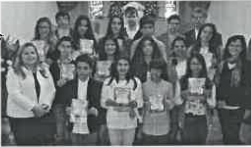
Adolescentes do 7º Ano e animadores

Estão de parabéns os adolescentes pelo modo como se prepararam para esta celebração e pelo modo como realizaram as diversas tarefas que lhes foram propostas. Estão de parabéns os seus animadores (catequistas), pelo modo como acompanharam estes adolescentes ao longo do ano da catequese e, em particular, pelo modo como prepararam a celebração destas festas e como ajudaram os adolescentes a desempenharem bem as tarefas que lhe foram propostas.