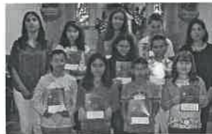
Adolescentes do 5º Ano e animadoras