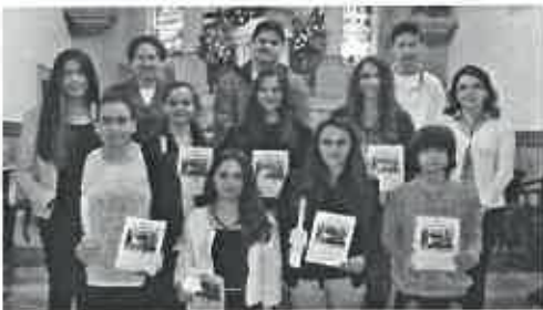
Adolescentes do 9º Ano e animadoras