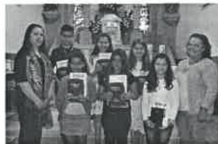
Adolescentes do 4º Ano e animadoras

Estão de parabéns as crianças dos quarto e quinto anos pelo modo como se prepararam para estas duas festas e pela maneira como realizaram as diversas tarefas que lhe foram confiadas. Estão de parabéns as suas catequistas pelo modo como acompanharam estas crianças ao longo do ano de catequese e como as prepararam para estas duas festas.