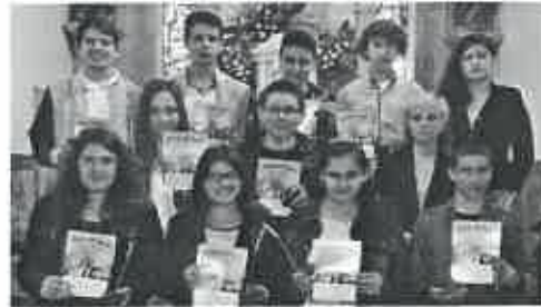
Adolescentes do 10º Ano e animadoras