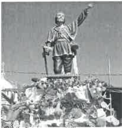
A decoração do andor de Sto Isidro foi original, com base em produtos agrícolas: cenouras, cebolas, feijão verde, abóboras, tomate...

Do programa constou a atuação da Banda "IMPAKTO", no dia 29 de julho. No dia seguinte, decorreu o Festival de Folclore com a presença dos Grupos Cantares do Neiva, de Sandiães (Ponte de Lima), de Castelo do Neiva (Viana do Castelo), Cantares das Marinhas e Cantares de S. Paio d'Antas, ambos de Esposende. No final deste festival atuou o artista RUIZINHO PENACOVA.