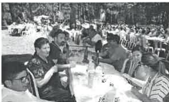
Após a Eucaristia seguiu-se um lauto almoço e...

Salientando que este dia nasceu de um convívio realizado o ano passado com os grupos da paróquia e que depois o Conselho Económico e Pastoral agarrou e lançou para se realizar o Dia da Paróquia. Assim, a organização esteve a cargo de todos os grupos de apostolado existentes na comunidade, tendo o pároco referido que "cada grupo trabalhou para que este dia resultasse em pleno".