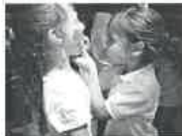
"Brisa de Mar" ouviu algumas vozes sobre este dia.

A Eucaristia foi animada pelos três grupos corais da comunidade paroquial, a saber, o