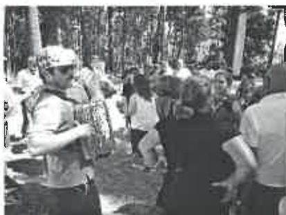
... muita animação com concertinas e cantares ao desafio.