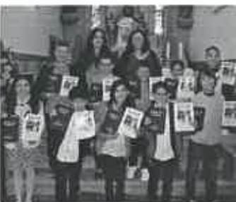
Crianças do 4º Ano e Catequistas

No dia 17 de abril, na igreja paroquial de S. Bartolomeu do Mar, 11 crianças que frequentam o 4º ano da catequese paroquial e oito crianças que frequentam o 5º ano celebraram, respetivamente, a Festa da Palavra e a Festa da Esperança, previstas nos guias das suas catequistas.