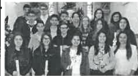
Adolescentes do 9º ano e Animadoras

O objetivo destas celebrações é levar os adolescentes a participarem mais ativamente na celebração da Eucaristia. E esse objetivo foi atingido plenamente. Estão de parabéns os adolescentes pela preparação que fizeram para esta celebração e pelo modo consciente e responsável como nela participaram. Estão de parabéns as suas animadoras, pelo trabalho feito ao longo do ano da catequese e pelo esforço dispendido na preparação e realização destas duas festas.