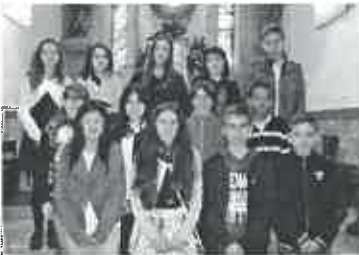
Adolescentes do 7º ano e Animadora

No passado dia dez de abril, na igreja paroquial de S. Bartolomeu do Mar, 12 adolescentes que frequentam o sétimo ano da catequese paroquial e 14 adolescentes que frequentam o nono ano celebraram, respetivamente, a Festa das Bem-Aventuranças e a Festa do Compromisso , vistas no guia das animadoras.