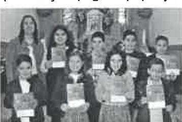
Crianças do 5º Ano e Catequista

Estão de parabéns as crianças pelo modo consciente e responsável como se prepararam e realizaram estas duas celebrações. Estão de parabéns as suas catequistas pelo trabalho realizado ao longo do ano da catequese e pelo esforço empregue na preparação e realização das duas festas.