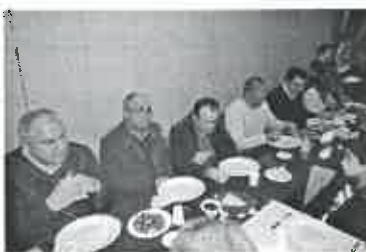
Mesa que presidiu à Ceia

O Agrupamento Nº 82, dos Escuteiros de S. Bartolomeu do Mar, realizou a sua tradicional Ceia de Natal sob o tema "Cear com S. Francisco", no dia 9 de janeiro, na Sede, no Centro Cívico de Mar, evento que reuniu a família escutista, familiares e amigos, além de convidados, como as entidades oficiais e locais.