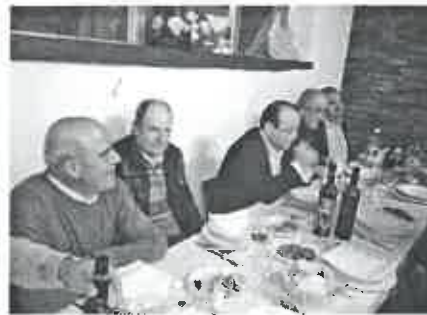
Mesa que presidiu ao jantar do Andebol do Centro Social de Mar