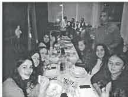
O sorriso é uma das marcas de referência das atletas do Centro Social de Mar

A terminar, agradeceu ao Centro Social, aos pais e aos diretores de andebol que têm sido incedíveis na resolução dos problemas".