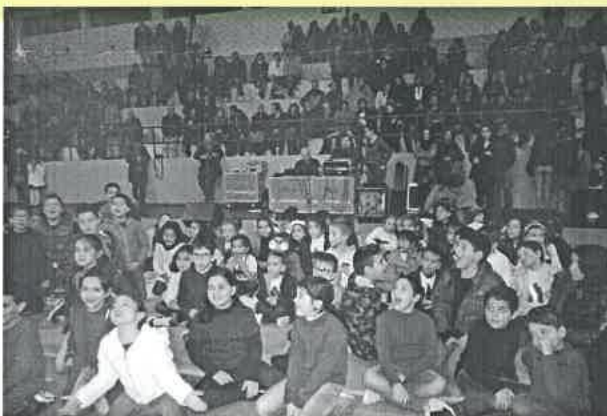
Festa de Natal do Centro Social da Juventude de Mar