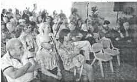
Assistência presente no lançamento do livro.