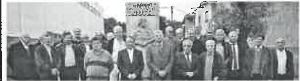
Ex-Combatentes e autoridades