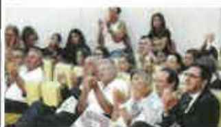
As autoridades concelhias e locais marcaram presença na Gala dos 40 anos do Centro Social da Juventude de Mar.