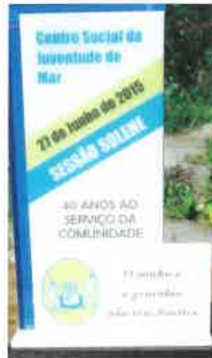
O Galardão comemorativo dos 40 anos do Centro Social da Juventude de Mar.