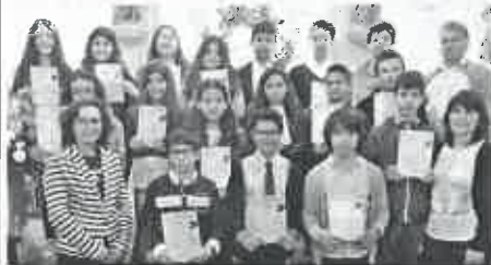
Adolescentes do 7º ano e seus animadores

Os adolescentes que frequentam o sétimo ano da catequese paroquial de S. Bartolomeu do Mar celebraram, no passado dia dez de maio, na igreja paroquial a Festa das Bem-Aventuranças prevista no guia do catequista.