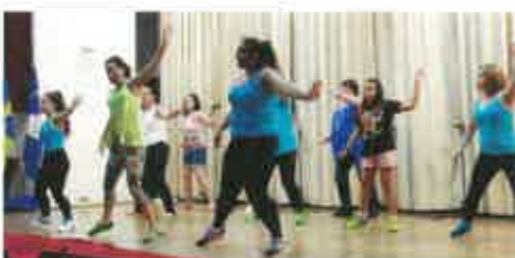
O Grupo de Danças do Centro Social mostrou como se dá ao pé e não só...