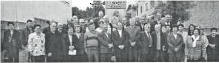
Ex-Combatentes de Mar, amigos e familiares