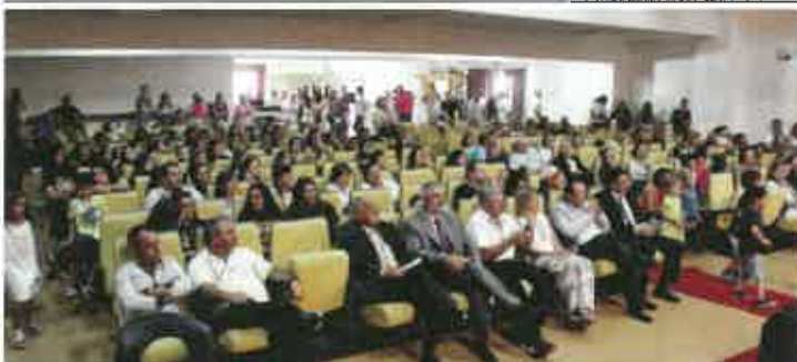
O público encheu o Salão Paroquial e nunca regateou aplausos aos homenageados.