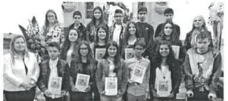
Adolescentes do 8º ano e suas animadoras

Os adolescentes que frequentam o oitavo ano da catequese paroquial de S. Bartolomeu do Mar celebraram, no passado dia quatro de abril, a Festa da Vida, prevista no guia do animador. A celebração foi integrada na Vigília Pascal, que começou às 22h30.