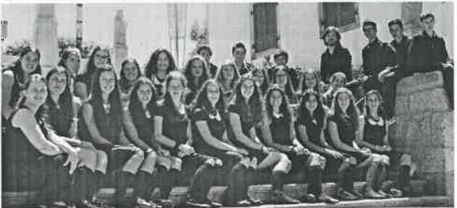
O Festival Zumba (foto 1) foi um êxito. O Coro "Ars Vocalis" (foto 2)