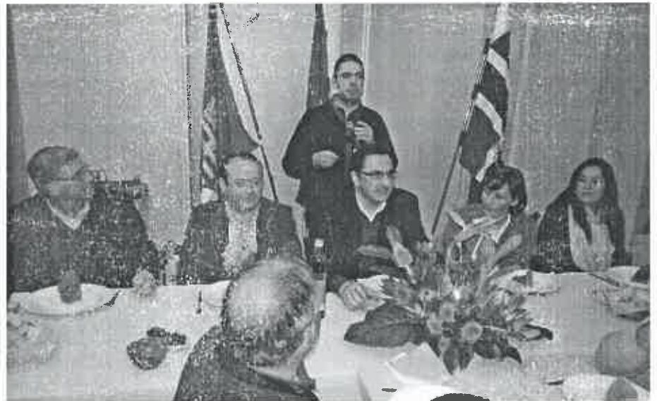
A Ceia de Reis dos Escuteiros de S. Bartolomeu do Mar foi uma festa.