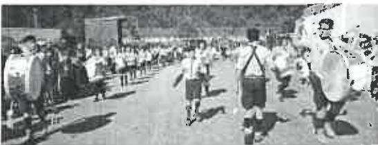
Escuteiros de Mar abriram as comemorações.

Presentes, ainda, as entidades que formam parceria com o Agrupamento nomeadamente a Cruz Vermelha das Marinhas, a Câmara Municipal através do projeto “Crescer Saudável” e a Liga Portuguesa contra o Cancro. A Cruz Vermelha esteve presente com duas ambulâncias, uma tenda e cinco socorristas e para além do apoio ao evento, do suporte básico de vida e de manobras de socorro, promoveu rastreios de indicadores de saúde, glicemia, peso, Índice de massa corporal e tensão arterial.