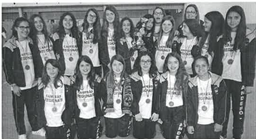
As INFANTIS da JuveMar são Campeãs Regionais de Braga em Andebol, só com vitórias!