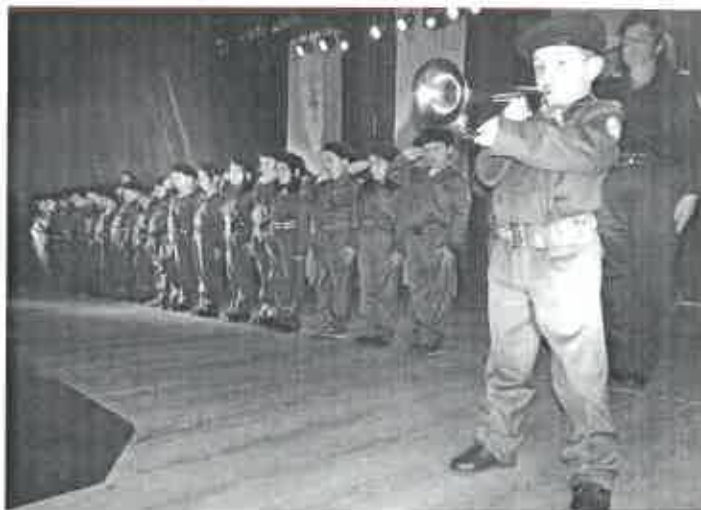
Os "Militares de abril" do Centro Social de Mar encantaram a plateia.