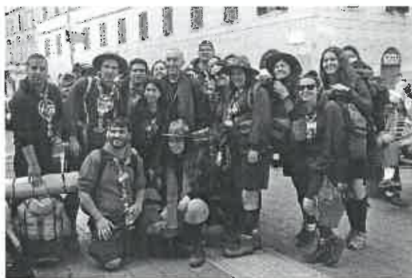
Os Escuteiros de Mar, em Roma, Itália, com o mediático Professor Marcelo Rebelo de Sousa.

cerimónias de canonização dos Papas João XXIII e João Paulo II. A atividade inseriu-se no Rover h'14 (Actividade específica para Camiñheiros), e foi organizada pela Junta Regional de Braga, em colaboração com a Pastoral Juvenil da Arquidiocese de Braga.