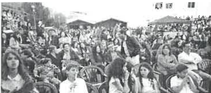
A comunidade educativa e escolar participou em peso.