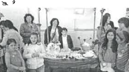
A Associação de Pais da Escola de Mar marcou presença no evento.

A abrir a tarde marcou presença a Fanfara do Agrupamento Nº 82, de S. Bartolomeu do Mar, seguindo-se a participação do Rancho Folclórico