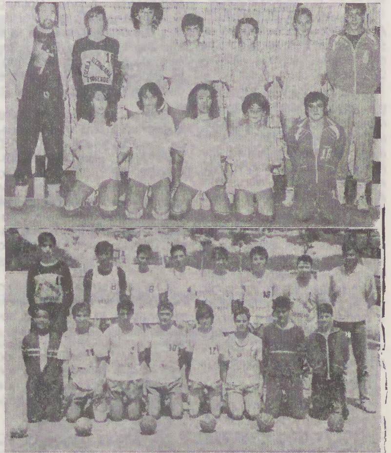
Equipas de juvenis femininos e masculinos, campeões nacionais do como prémio o Torneio da Madeira.

A época está prestes a terminar, faltando apenas os dois torneios internacionais para rapazes e raparigas. Agosto, será tempo de merecidas férias e em 1 de Setembro recomeçará a actividade, pois temos imensos