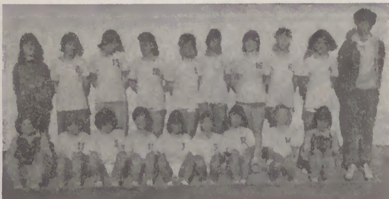
Iniciadas femininas 87/88

femininos), com 155 atletas em acção, dos quais, 10% foram reprovados, escolarmente falando. Fizemos até ao momento 221 jogos, com 105 vitórias, 10 empates e 106 derrotas. Foram marcados