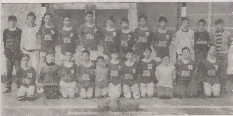
Iniciados masculinos 87/88

Na corrente época de 87/88, o Andebol está cada vez mais febril, com 10 equipas (excepto juniores e seniores