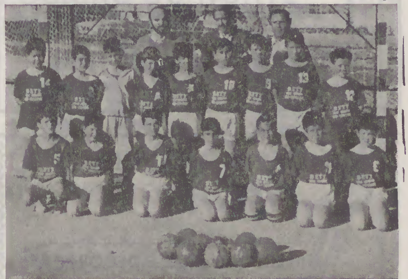
Infantis masculinos 87/88

convites para participar em torneios desde Lisboa a Lagos, logo no princípio da época. O Andebol está imparável em Esposende, desde que o Conselho Directivo da Escola Secundária continue a apoiar-nos como até aqui. Igualmente será justo referir