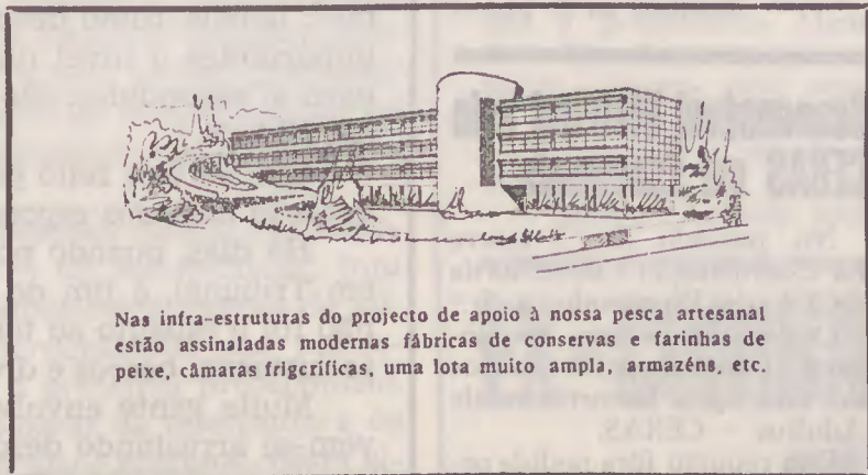
Nas infra-estruturas do projecto de apoio à nossa pesca artesanal estão assinaladas modernas fábricas de conservas e farinhas de peixe, câmaras frigoríficas, uma lota muito ampla, armazéns, etc.

Segundo o preâmbulo do projecto-proposta, o Porto de