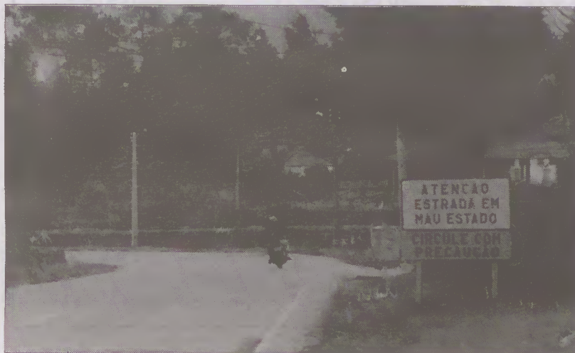
O mau tempo deixou a E.N. 103 muito danificada

Mas a chuva e sobretudo o forte vento que se fez sentir fizeram outros estragos, derrubando antenas, telhas e estufas. Foi a intempérie a fazer das suas e a deixar as marcas.