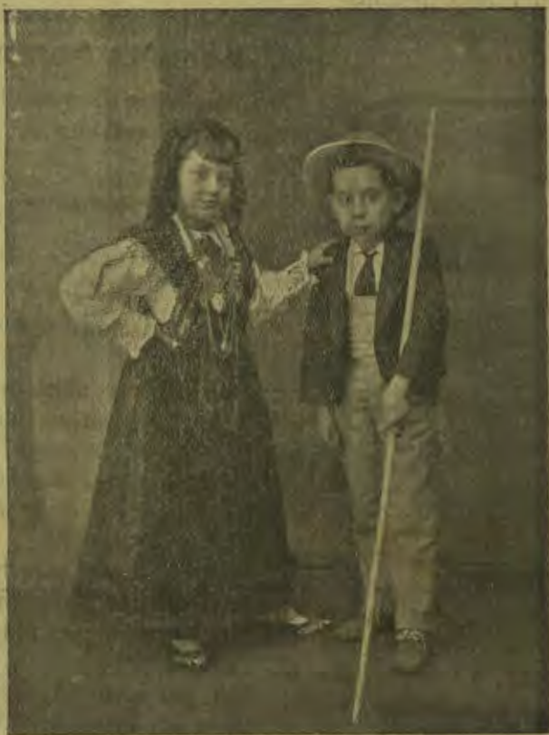
Costumes infantis minhotos

Diz o notavel medico e sabio italiano Mantegazza: «Nenhum filho de familia operaria e nevrotica devia ser condemnado a ezercer profissão sedentaria ou a tornar-se roda de maquina de officina. Deveria, sendo possivel, praticar para trabalhador rural ou