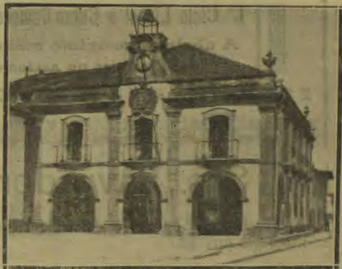
Edifício da Câmara Municipal