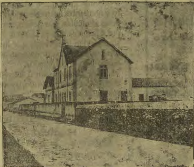
Estrada Nacional e Escolas Rodrigues Sampaio.