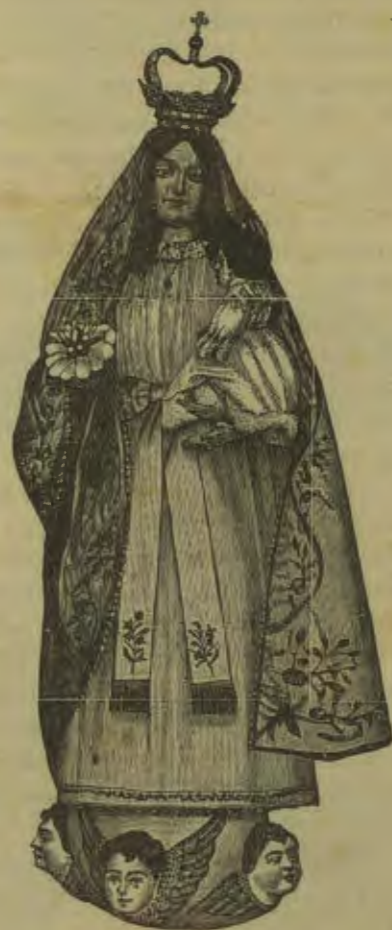
Nossa S.ª da Saúde

Pelo costume dos anos anteriores realizam-se, nesta vila amanhã, domingo, segunda, terça e quarta-feira, as tradicionais festas da Vila, em honra de N. Senhora da Saúde, que este ano vão revestir-se de excepcional importância.