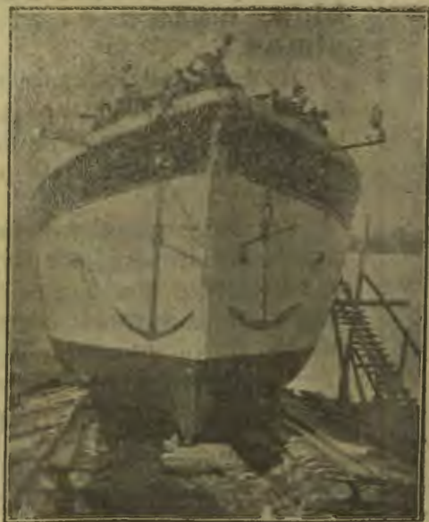
Antigo estaleiro naval