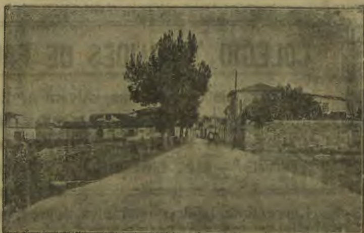
Estrada Nacional e Entrada Sul desta vila.