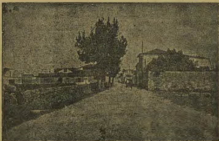
Entrada da vila, lado sul.