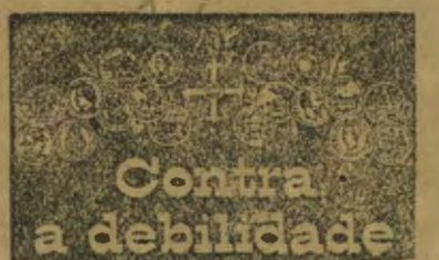
Família Peitoral Ferruginosa da Farmacia Franço

Esta farinha é um precioso medicamento pela sua acção tónica reconstituinte, do mais reconhecido provelto nas pessoas anemicas, de constituição fraca, e, em geral, que carecem de forças no organismo, e ao mesmo tempo um excelente alimento reparador, de facil digestão, utilissimo para pessoas de estomago debil ou enfermo, para convalescentes, pessoas idosas ou crianças.