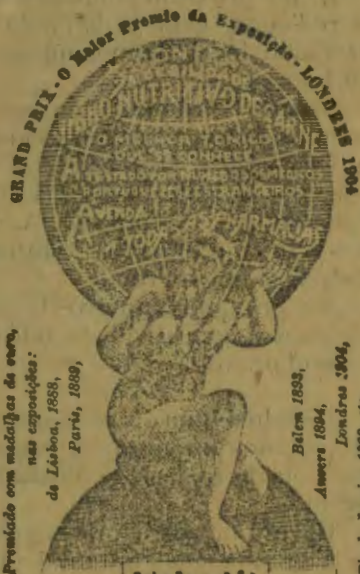
Premiado com medalhas de ouro nas exposições: de Lisboa, 1888, Paris, 1889, Belem 1892, Amara 1894, Londres 1904, Rio de Janeiro 1907 e 1908.

N'esta Redacção, indica-se a pessoa autorizada a receber os capitais de qualquer subscritor, em acções nominaes de 40$00 escudos.