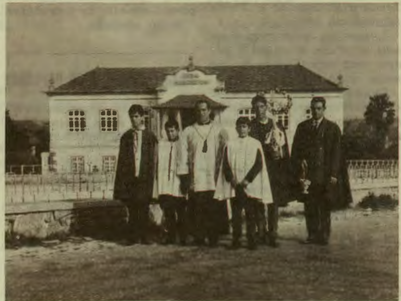
E CRISTO RESSUSCITOU... CORAGEM...

Finalmente surgirá a Paz, a alegria suave e então descobriremos que as contradições da vida não são outra coisa senão uma chamada familiar e amiga do Senhor, convidando-nos a subir cada vez mais alto. Coragem pois!