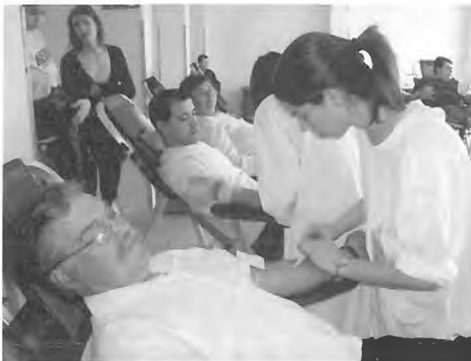
A disponibilidade e generosidade das pessoas de Mar esteve presente em mais uma dádiva de sangue.

corpo do ser humano pode produzir e cuja capacidade de entrega e generosidade é grande, como o tem demonstrado o elevado número de pessoas que compareceram, apesar de nesse dia terem decorrido outras actividades paralelas.