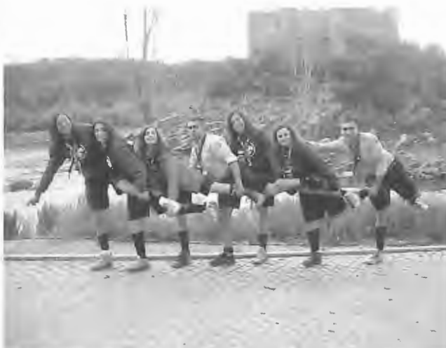
O grupo visitou o Castelo de Almourol em pleno Rio Tejo

E, após alguns contactos junto do Centro Social da Juventude de Mar, para a cedência da carrinha para a nossa desloca-