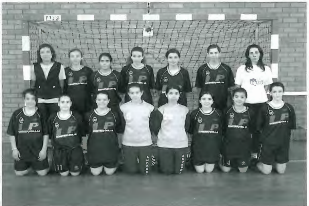
As Infantis da Juventude de Mar são campeãs Distritais e Medalha de Bronze Nacional