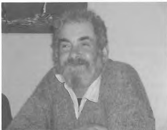
Problemas pessoais obrigam à continuidade da suspensão do mandato de Abílio Cerqueira.