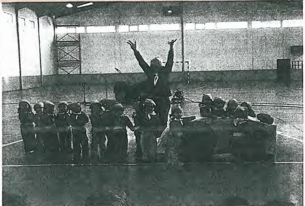
Crianças coreografaram o Noddy que encantou toda a gente

O Centro Social da Juventude de Mar realizou, no dia 16 de Dezembro, pelas 15 horas, a Festa de Natal para todas as crianças que frequentam a Instituição.