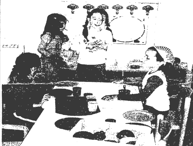
Meninos da Sala dos 5 anos