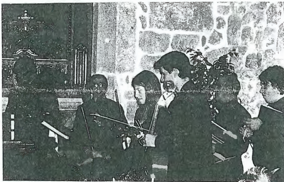
Grupo de Câmara de Esposende brilhou na Igreja Velha

O encerramento das comemorações do bicentenário do nascimento de António Rodrigues Sampaio ocorreu no passado dia 24 de Julho. A marcar a efeméride decorreu na Igreja Velha, em S. Bartolomeu do Mar, local histórico na vida daquela ilustre figura de Esposende, presa no dia 1 de Novembro de 1828, um concerto pelo Grupo de Câmara de Esposende. A qualidade de execução instrumentista, as magníficas vozes e toda a ambiência tornaram o concerto deslum-