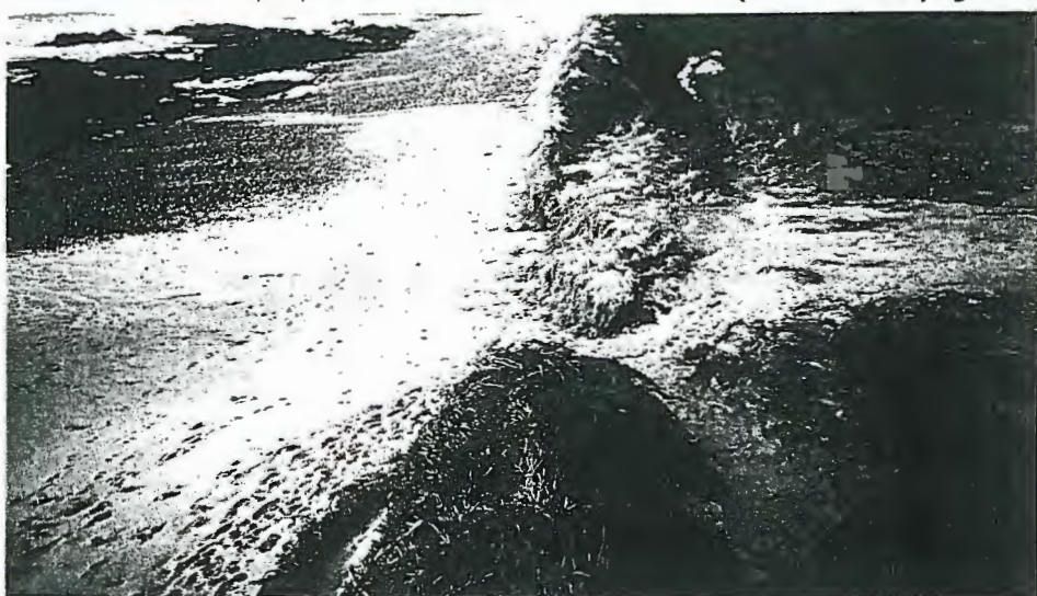
A duna foi "comida" pelo mar que invadiu os campos

aberto, foi só levar a areia à sua frente. O passadiço existente no local ( Continua na página 6 )