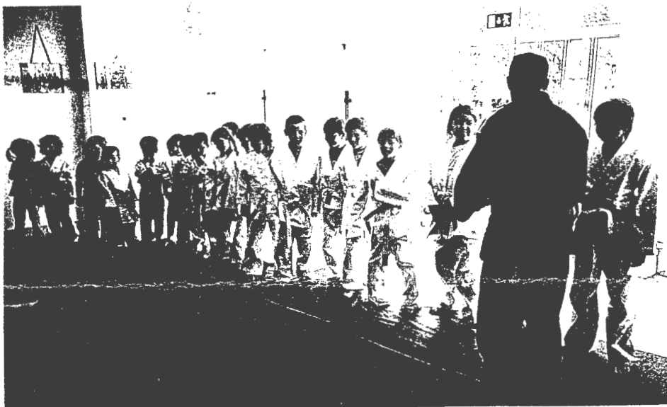
JUDO EM MAR - Aos sábados são várias dezenas de crianças que se deslocam ao Centro Social de Mar para aprenderem Judo, um desporto são que ajuda à concentração e atenção e liberta o stresse da semana. As crianças gostam tanto que faltar constitui uma dor de cabeça. Parabéns e bons ganchos.