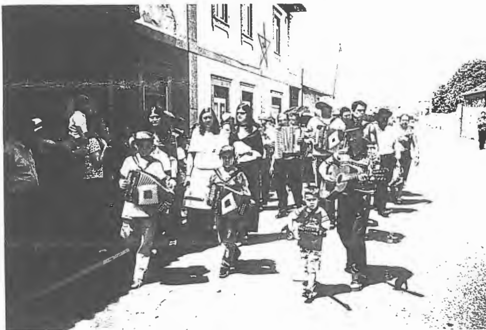
Participação no Cortejo promovido pela Comissão de Festas de S. Bartolomeu "é de pequenino que se torce o pepino"

Os noivos passaram a residir em Famalicão.