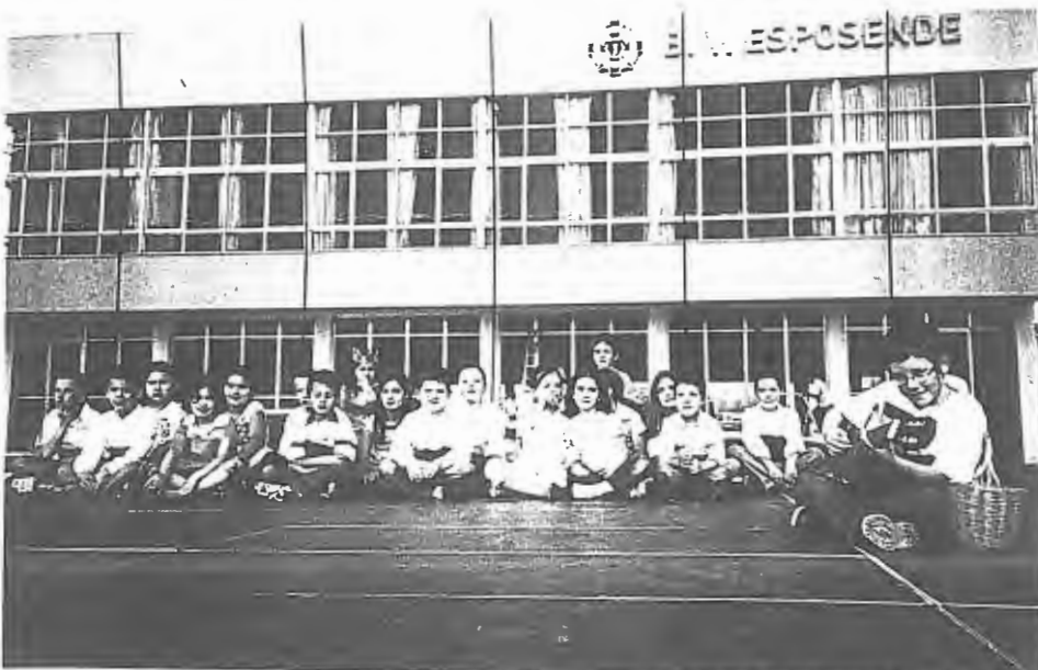
As crianças do Centro Social de Mar animaram uma tarde da Mostra da Solidariedade de Esposende