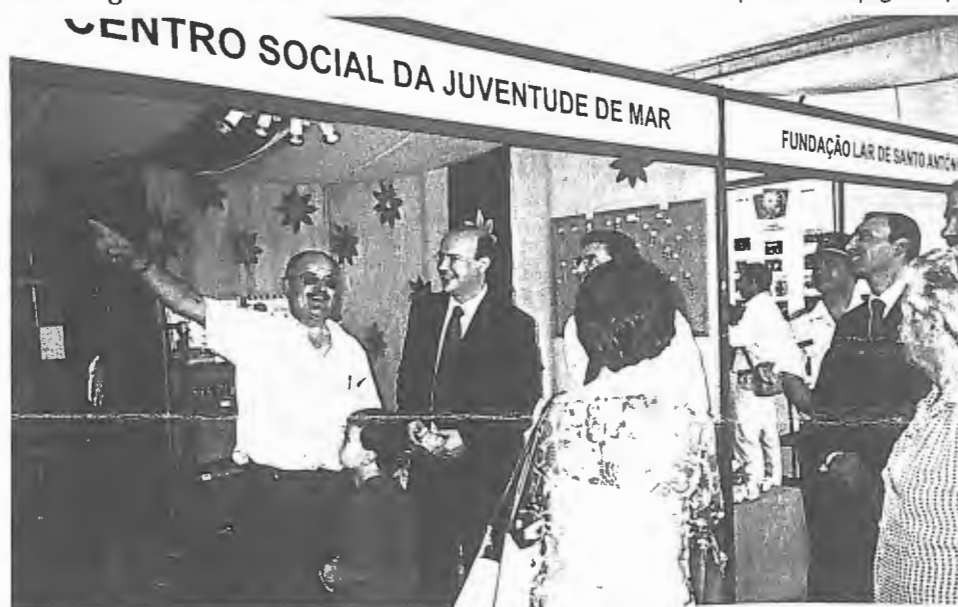
Uma vez mais o Centro Social de Mar marcou presença na Mostra da Solidariedade de Esposende