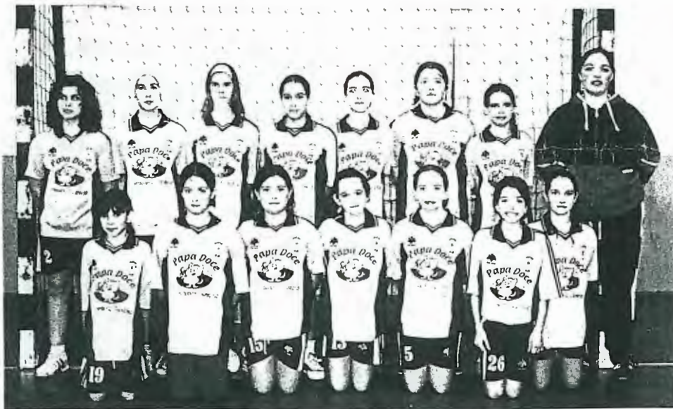
As Infantis do Juventude de Mar ganharam o primeiro título da época: Encontro Regional de Andebol, do Porto