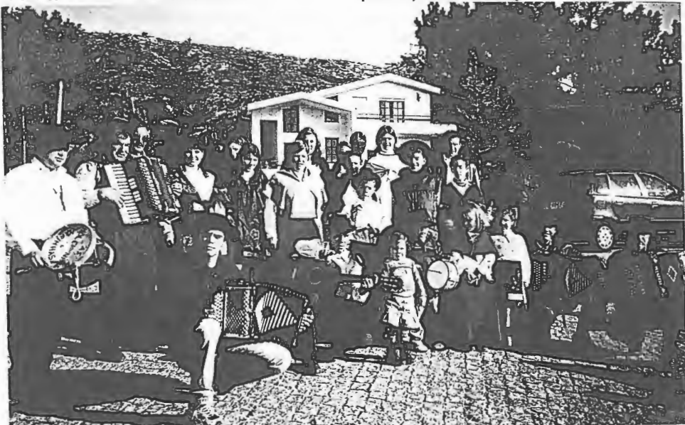
O Grupo de Janeiras de Mar cumpriu a tradição e ajudou a Comissão de Festas

A Comissão agradece a todos os elementos que trabalharam e à população que foi generosa e que mais uma vez contribuiu com os seus donativos para ajuda nas despesas das Festas.