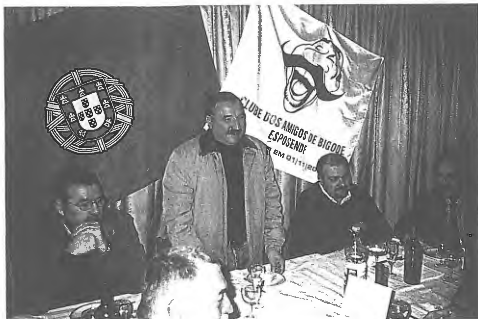
O Clube dos Bigodes quer ter uma acção de solidariedade