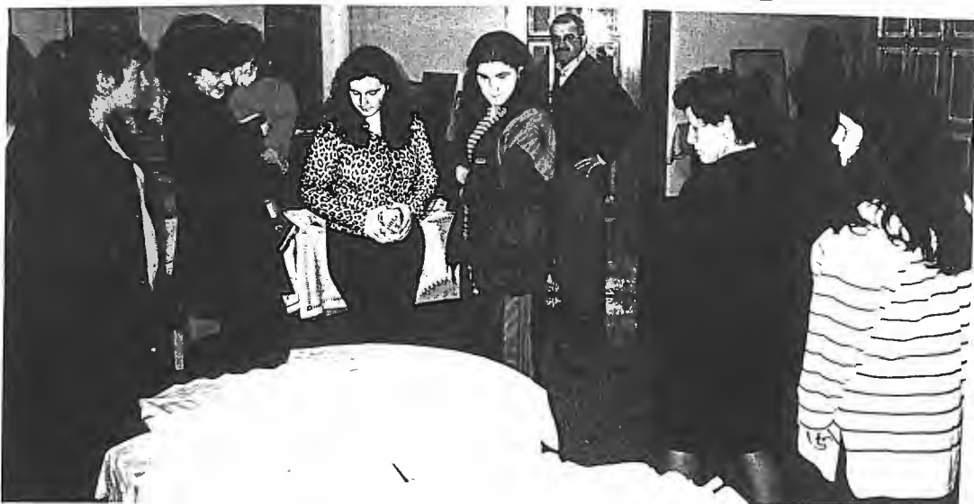
A Exposição de Bordados e Pintura foi um êxito.