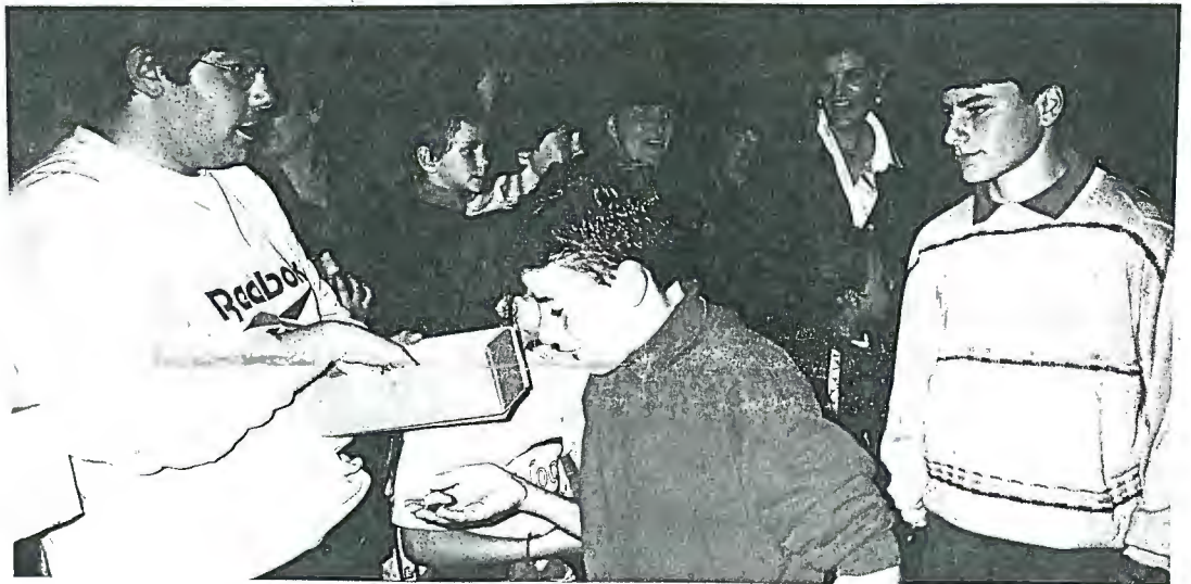
O Centro Social homenageia os seus atletas

E, se o conjunto de música popular "Cantares do Cávado", de Marinhas, dignificou a festa e fez os menos atrevidos dar à perna e animou o espectáculo, não